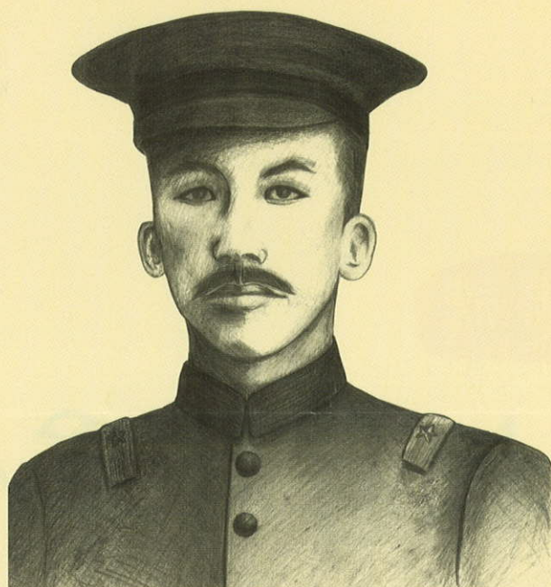
(繪圖/林嬰玉。詩文/林武隆)